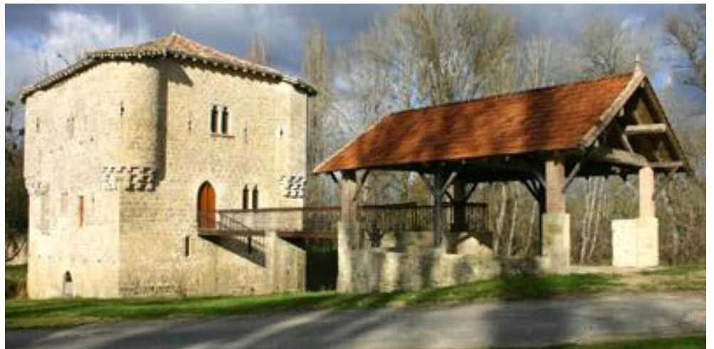
Moulin de Bagas