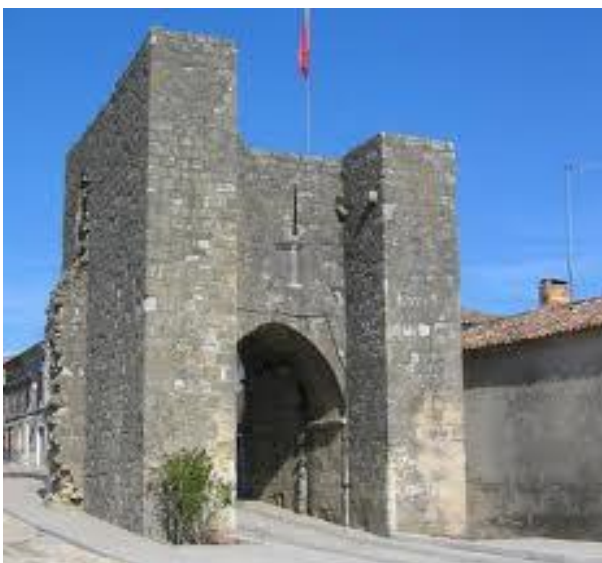
Sauveterre de Guyenne