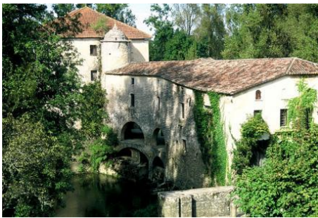
Moulin pont de Loubens