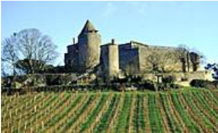
Château de Benauges