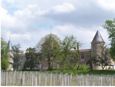
Château de Malromé