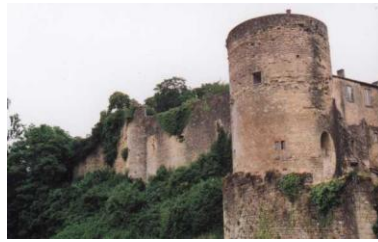
Château des Quat'Sos