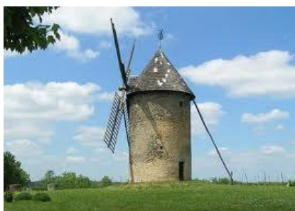
Moulin de Gornac ...