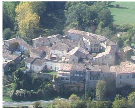
Castelmoron d' Albret