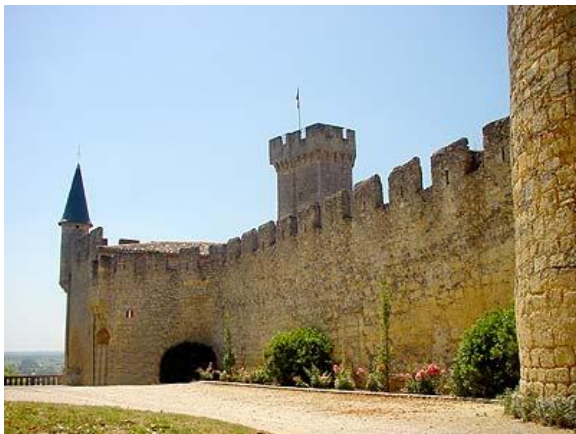
Château de Taste Sainte Croix du Mont