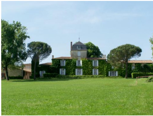
Château de Malagar