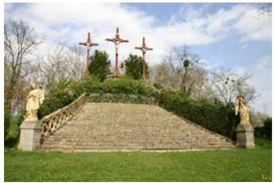
Calvaire de Verdelaïs