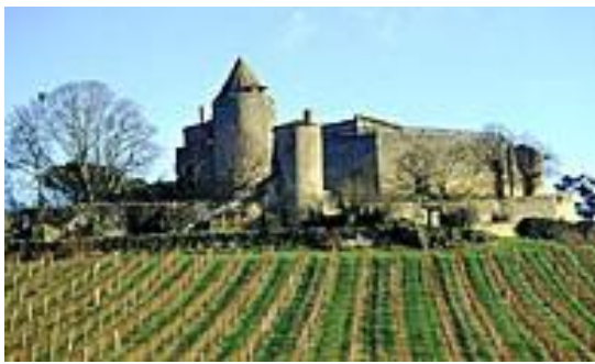
Château de Benauges