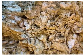
Falaise d'huîtres Sainte Croix du Mont