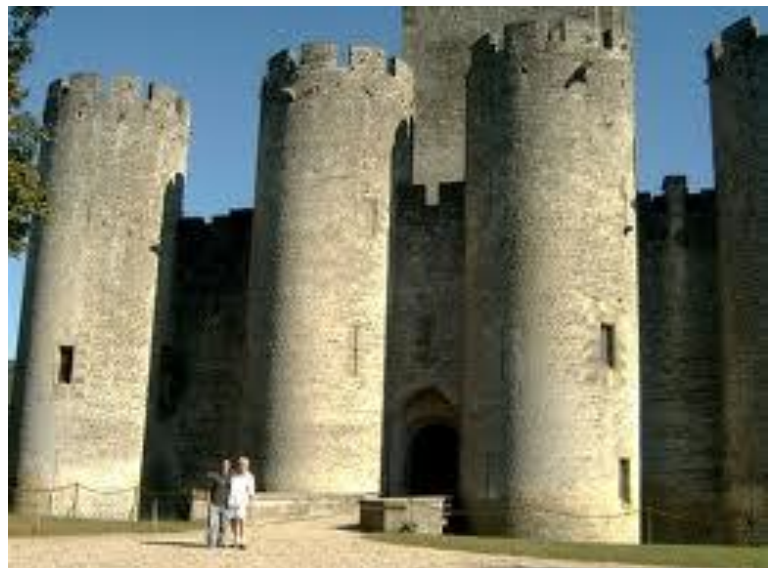
Château de Villandraut