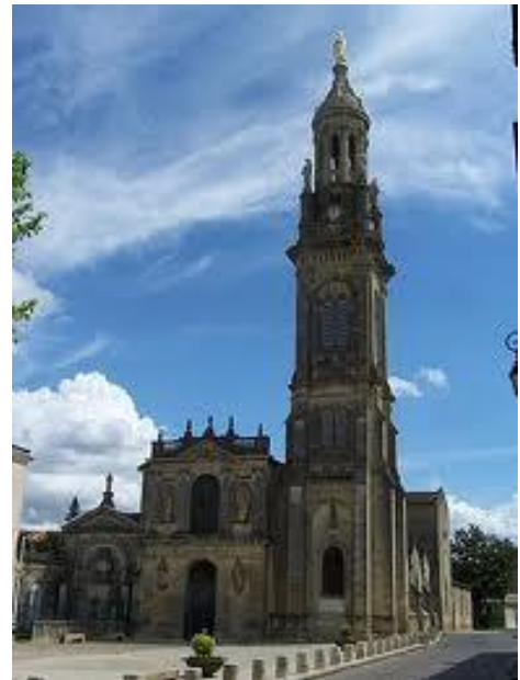
Basilique de Verdélais