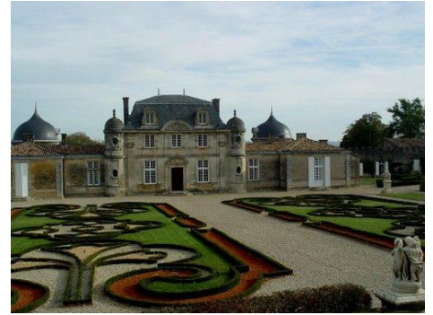
Château de Malle