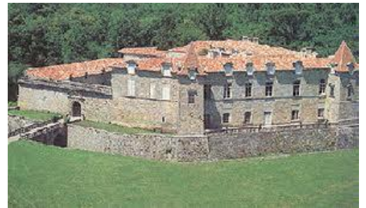
Ch. de Cazeneuve