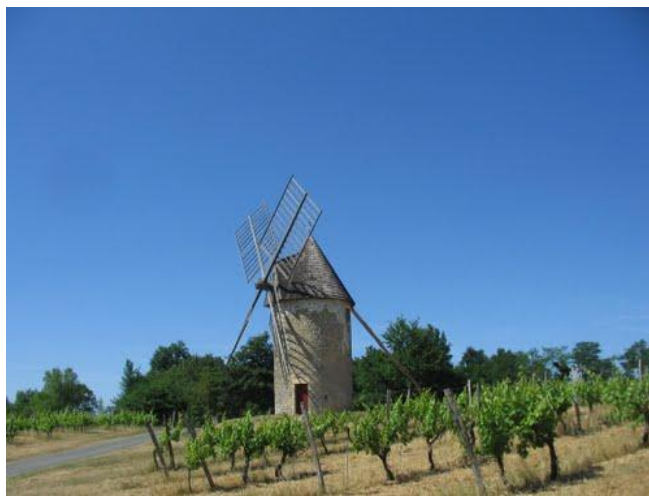
Moulin de Cussol