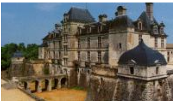
Château de Cadillac